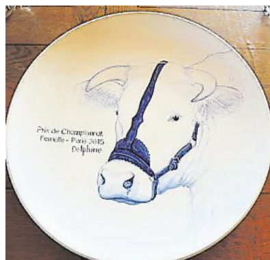
Un trophée représentant « Delphine » qui fait la fierté du Gaec Richard.

Delphine , charolaise vendéenne, est rentrée lauréate du Salon de l'agriculture de Paris. L'animal, élevé au Gaec Richard, de Saint-Révérend, est une véritable bête de concours.